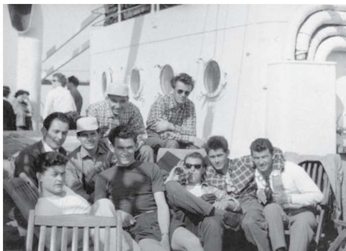
In viaggio verso l'Australia – maggio 1955