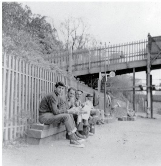
Operai italiani – Jolimont Station – 1956