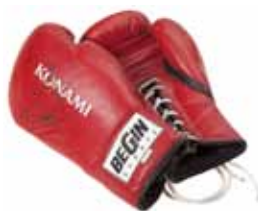
Guantoni da puglie