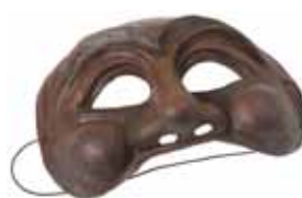
Maschera della Commedia dell'Arte